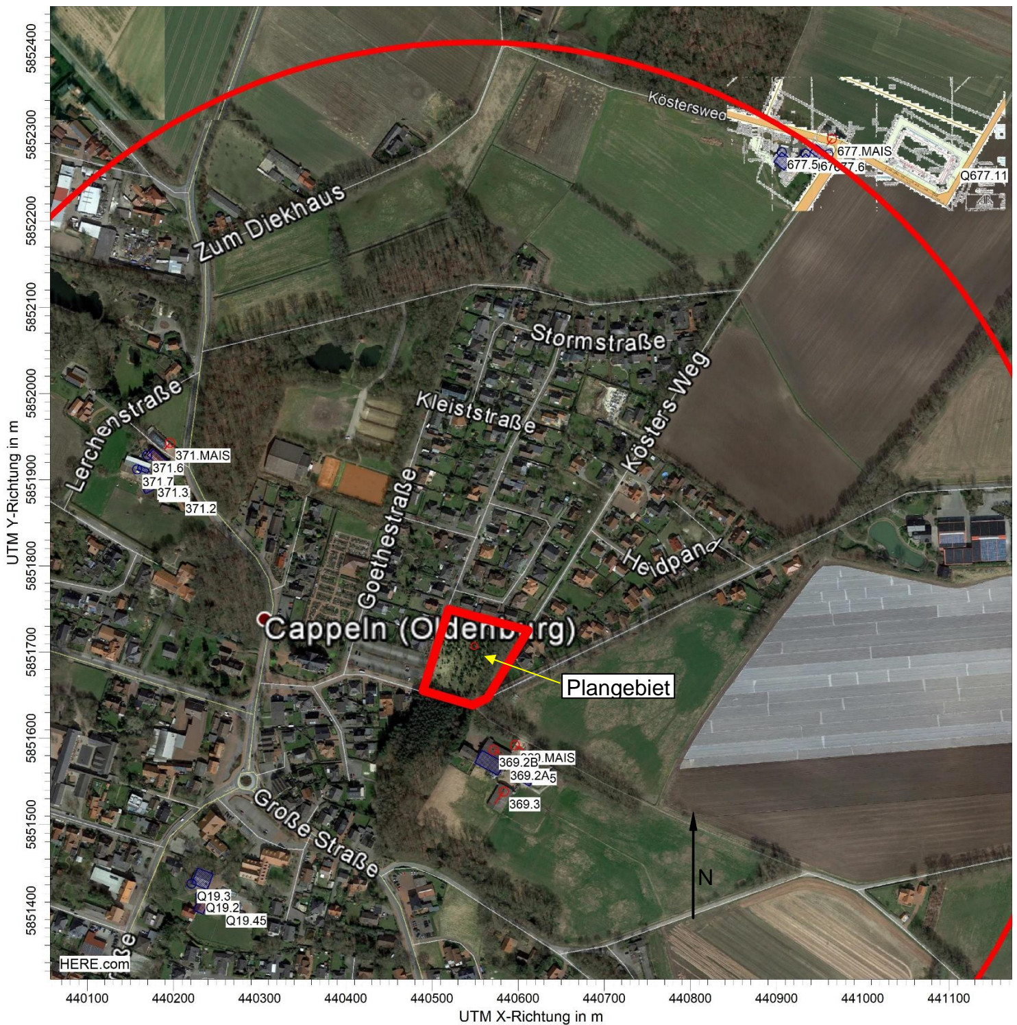
Abbildung 1: Lageplan; Hintergrundbild © Google Stallanlagen (Zuordnung der Geruchsquellen: s. S. 5) Plangebiet