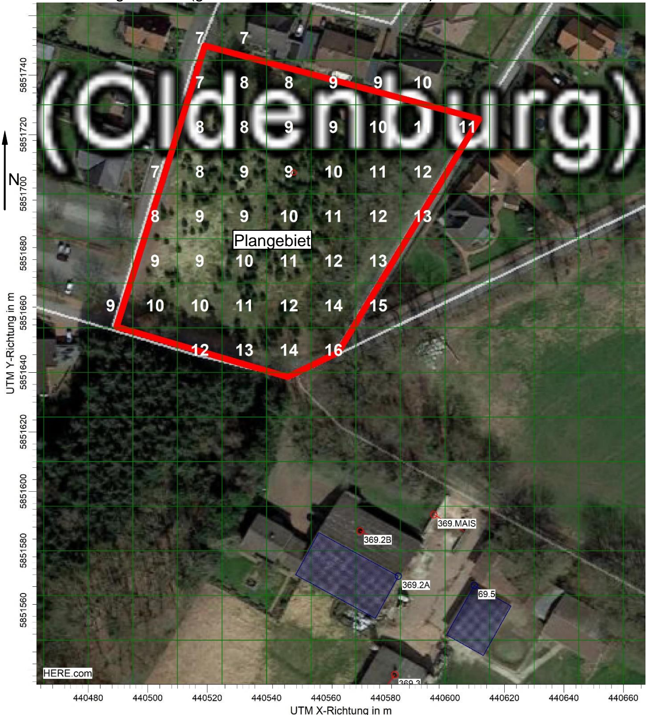
Abbildung 4: belästigungsrelevante Kenngrößen der Gesamtbelastung nach /2/ durch landwirtschaftliche Betriebe in Prozent der Jahresstunden im Plangebiet.

In der Abbildung 4 werden die Kenngrößen für die Gesamtbelastung im Plangebiet dargestellt. Angegeben sind die belästigungsrelevanten Kenngrößen nach /2/ für die Beurteilungsflächen (gleiche Größe wie Rechenzellen).