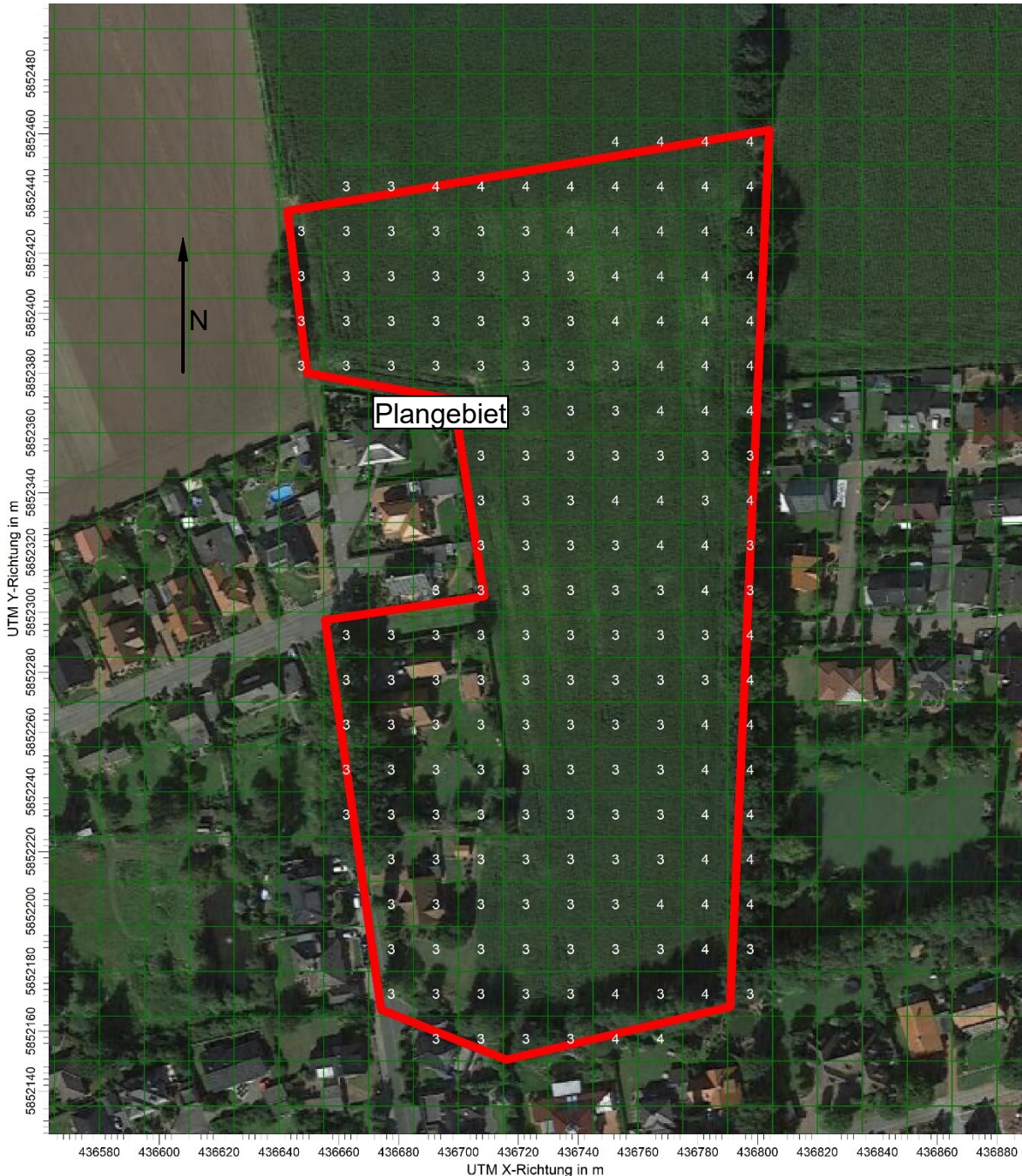
Abbildung 4: belästigungsrelevante Kenngrößen der Gesamtbelastung nach /2/ durch landwirtschaftliche Betriebe in Prozent der Jahresstunden im Plangebiet. Zur Bestimmung der Kenngrößen als relative Häufigkeiten müssen die Werte in der Abbildung mit dem Faktor 0,01 multipliziert werden.

In der Abbildung 4 werden die Kenngrößen für die Gesamtbelastung im Plangebiet dargestellt. Angegeben sind die belästigungsrelevanten Kenngrößen nach /2/ für die Beurteilungsflächen (gleiche Größe wie Rechenzellen).