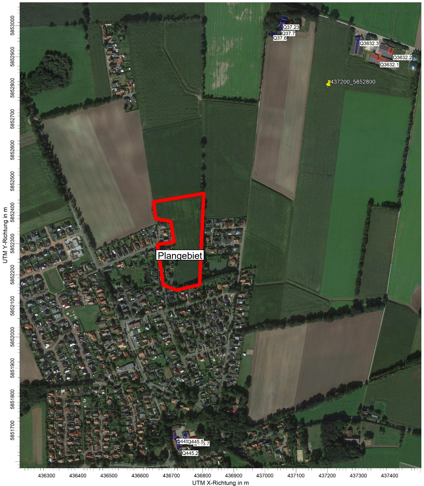
Abbildung 1: Lageplan; Hintergrundbild © Google Stallanlagen (Zuordnung der Geruchsquellen: s. S. 5) Plangebiet